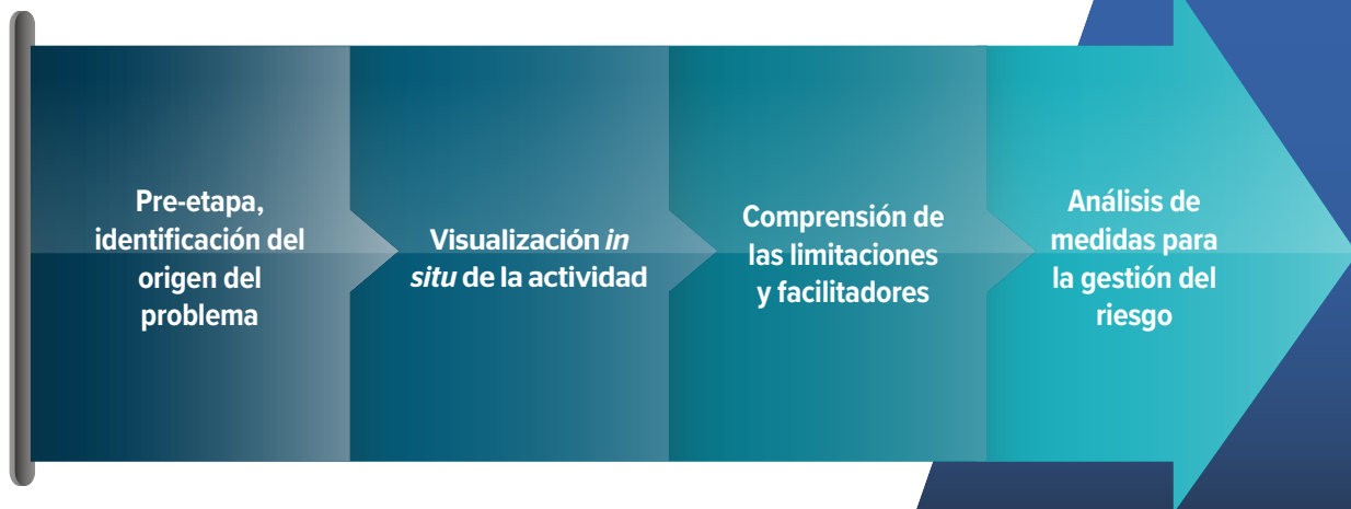
Figura 1. Análisis de actividad por etapas

Fuente: Ávila, 2023, Etapas del análisis de la actividad.