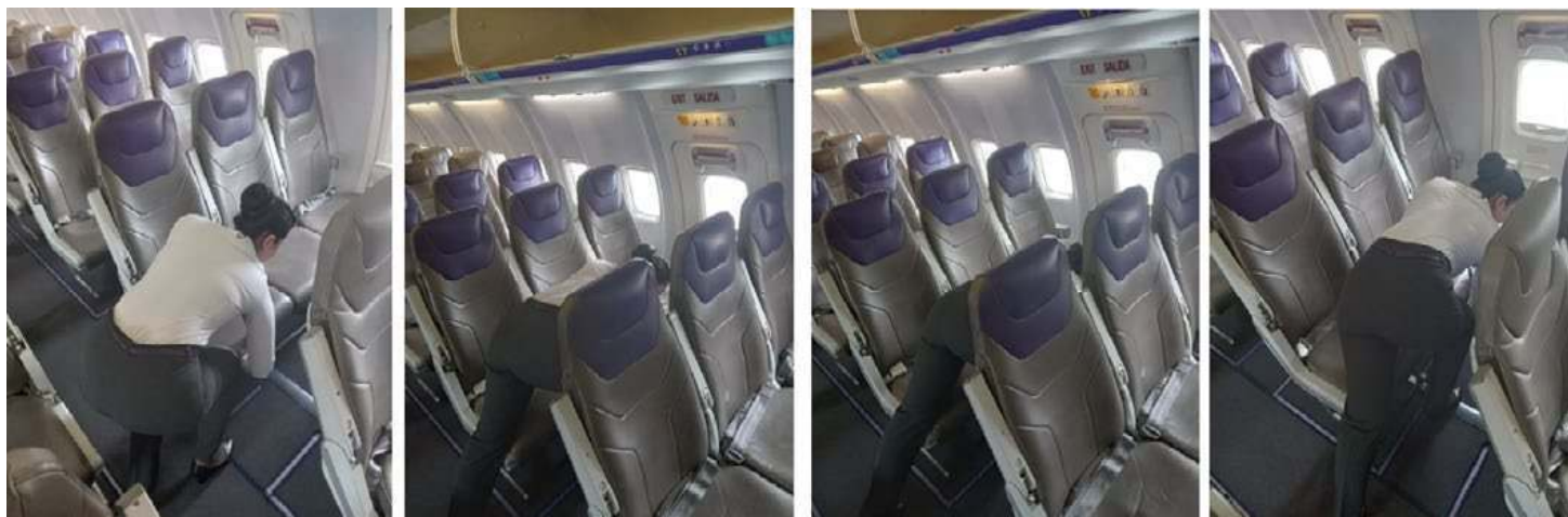
Aerorepública, 2023. Tripulante cabina de pasajero palpando el chaleco salvavidas

La primera etapa del prediagnóstico permitió establecer que la tripulación de cabina de pasajeros realiza revisión manual de chalecos adoptando posturas fuera de los ángulos de comfort , esto a causa de la distancia entre las sillas de la aeronave, el tiempo de tránsito entre vuelos y la exigencia por parte de la compañía de palparlos para la verificación de su existencia en cada silla de una aeronave comercial.