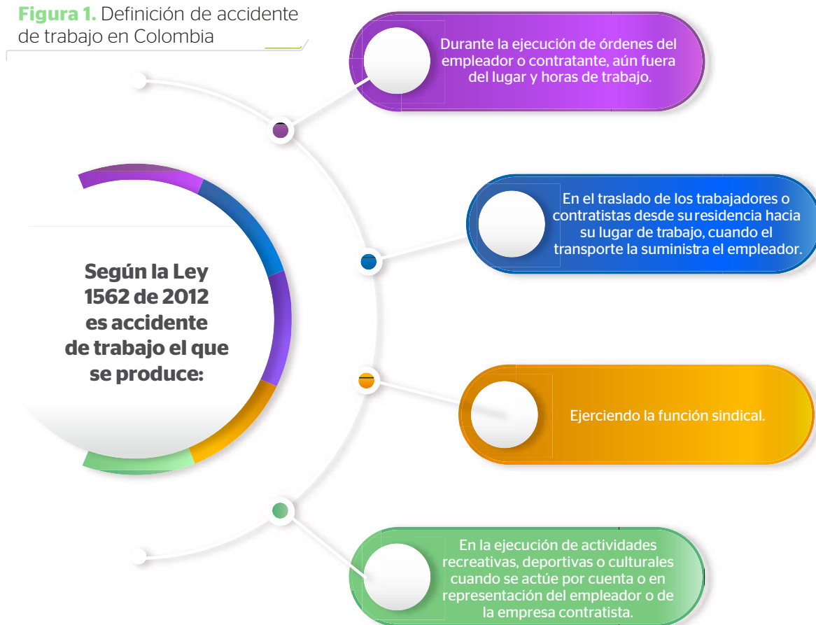
Figura 1. Definición de accidente de trabajo en Colombia

dente de trabajo como cualquier hecho que cause una alteración en la salud del trabajador, siempre y cuando esté vinculado de manera directa o indirecta a sus actividades laborales (ver figura 1).