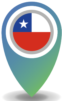
Inicio de la implementación SGA: 2004

Fuente: Secretaría de Gobierno de México, 2011; Secretaría del Trabajo y Previsión Social, 2015.