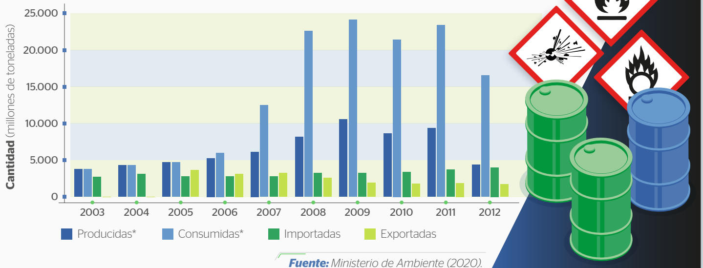
Figura 2. Balance global de las sustancias químicas industriales en Colombia excluyendo cementos y escorias

Teniendo en cuenta las cantidades de sustancias químicas importadas, producidas y consumidas, el programa se propone establecer un inventario nacional de sustancias químicas industriales a partir de información como la identificación del importador o productor, la cantidad, las clasificaciones SGA y los usos e identificación de la SQUI-CAS 1 , con un umbral propuesto de 100 kg por año y por sustancia, ya sea monoconstituyente, multi-constituyente o mezcla identificada y clasificada según el SGA.