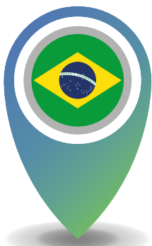
Inicio de la implementación SGA: 2001

Fuente: Ministerio de Salud de Chile, 2015; Ministerio de Salud de Chile, 2021.