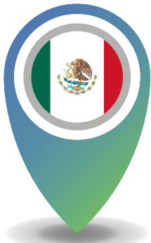
Inicio de la implementación SGA: 2006