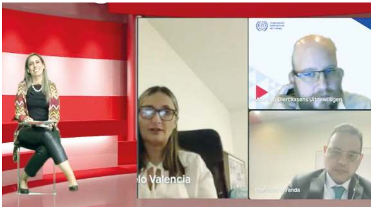
1. Durante el panel académico ‘El empleo como política social para la sostenibilidad’ se abordaron los retos del país en materia de trabajo decente.

Este trabajo aborda el incidente que se presentó en el Aeropuerto El Dorado, cuando un avión que aterrizaba se estrelló contra un globo aerostático que yacía en una pista. Aunque no hubo lesionados, el hecho pudo convertirse en una grave tragedia aérea.