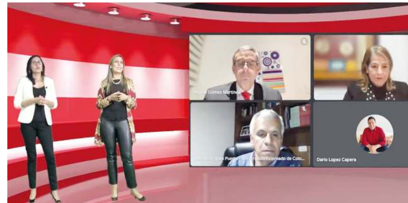
2. En la ceremonia de premiación, los jurados calificadoros destacaron la calidad informativa y la rigurosidad investigativa de los trabajos ganadores.