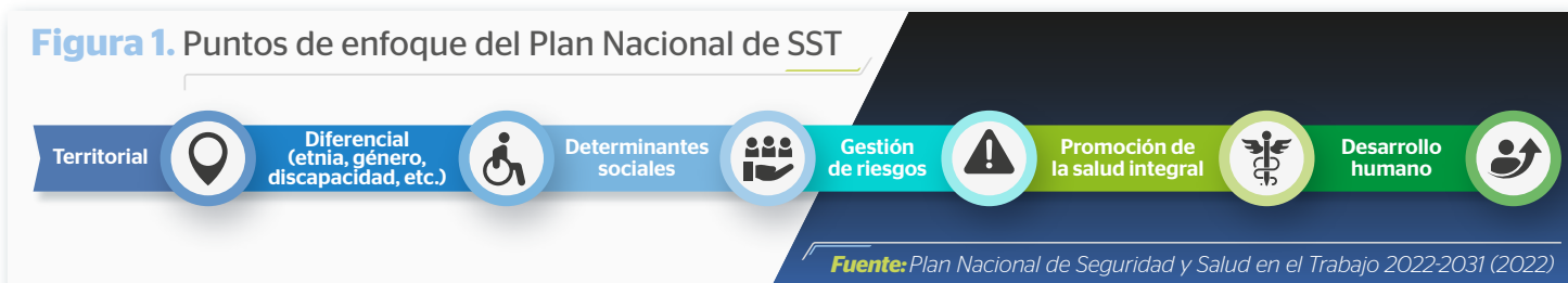
Figura 1. Puntos de enfoque del Plan Nacional de SST