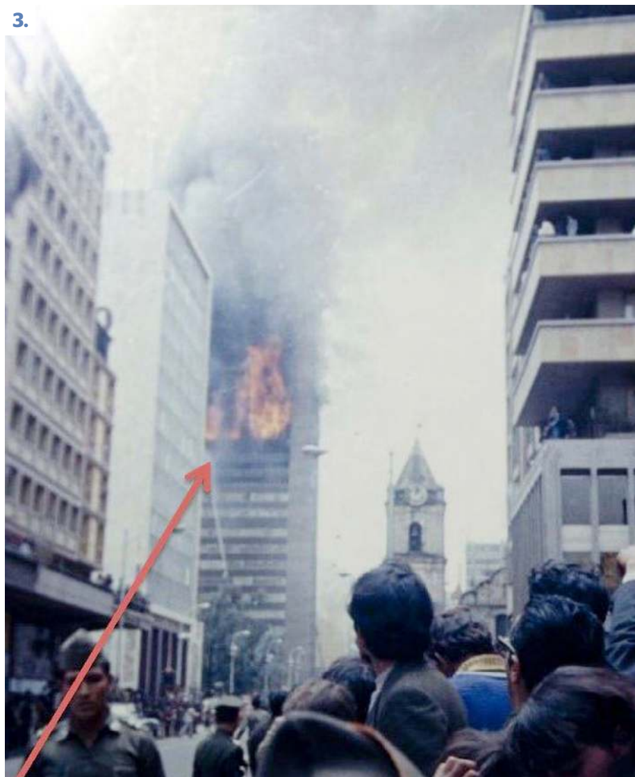
1 y 3. Máximo alcance de los chorros de agua.