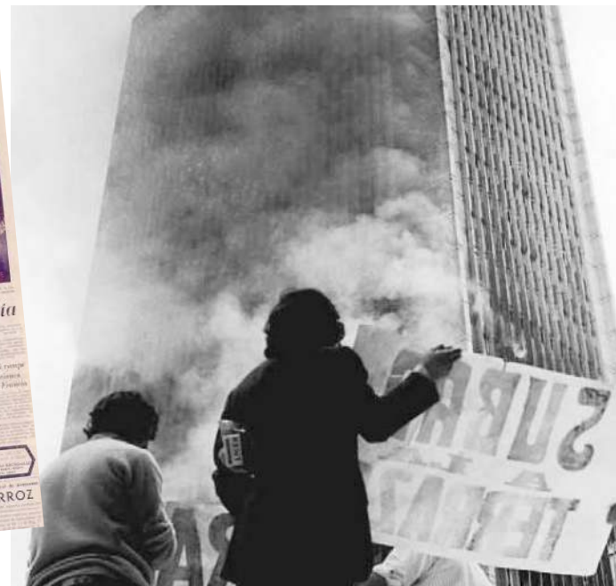
(Izquierda) Noticia de la tragedia en portada del periódico El Tiempo, edición 24 de julio 1973. (Derecha) Con carteles, los ciudadanos y organismos de socorro daban indicaciones a los ocupantes del edificio.