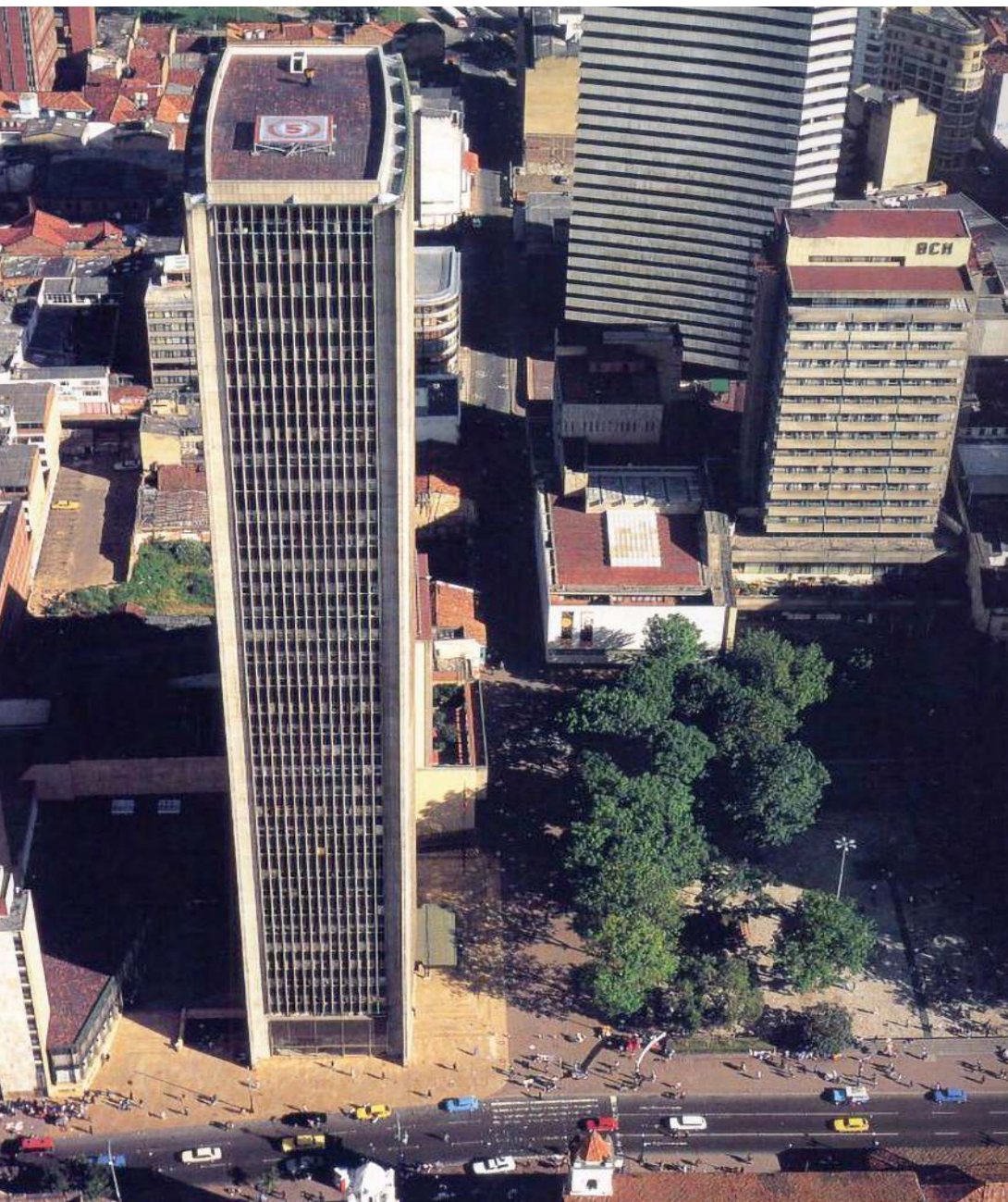
Tras la tragedia y las labores de reconstrucción, el Edificio Avianca fue reinaugurado y hasta el día de hoy la estructura está en funcionamiento.