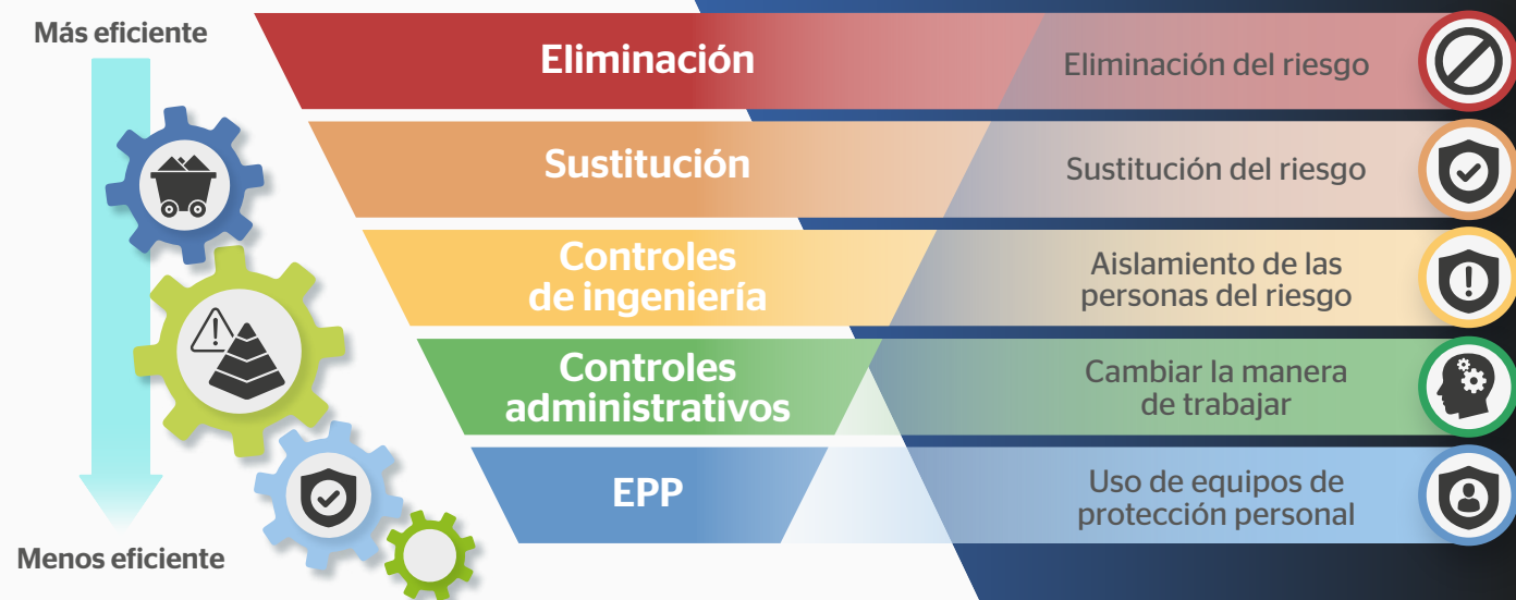
Figura 1. Jerarquización de controles