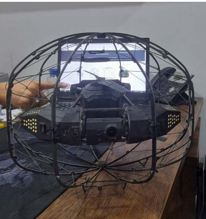
Drone para espacios confinados.

En definitiva, la Cuarta Revolución Industrial está generando una transformación profunda en todas las áreas industriales y la seguridad no es una excepción. Al respecto, las tareas de alto riesgo, como trabajos en alturas, excavaciones, espacios confinados e izajes de carga, requieren un enfoque holístico. La convergencia de la automatización, la inteligencia artificial