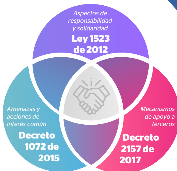
Figura 2. Normatividad