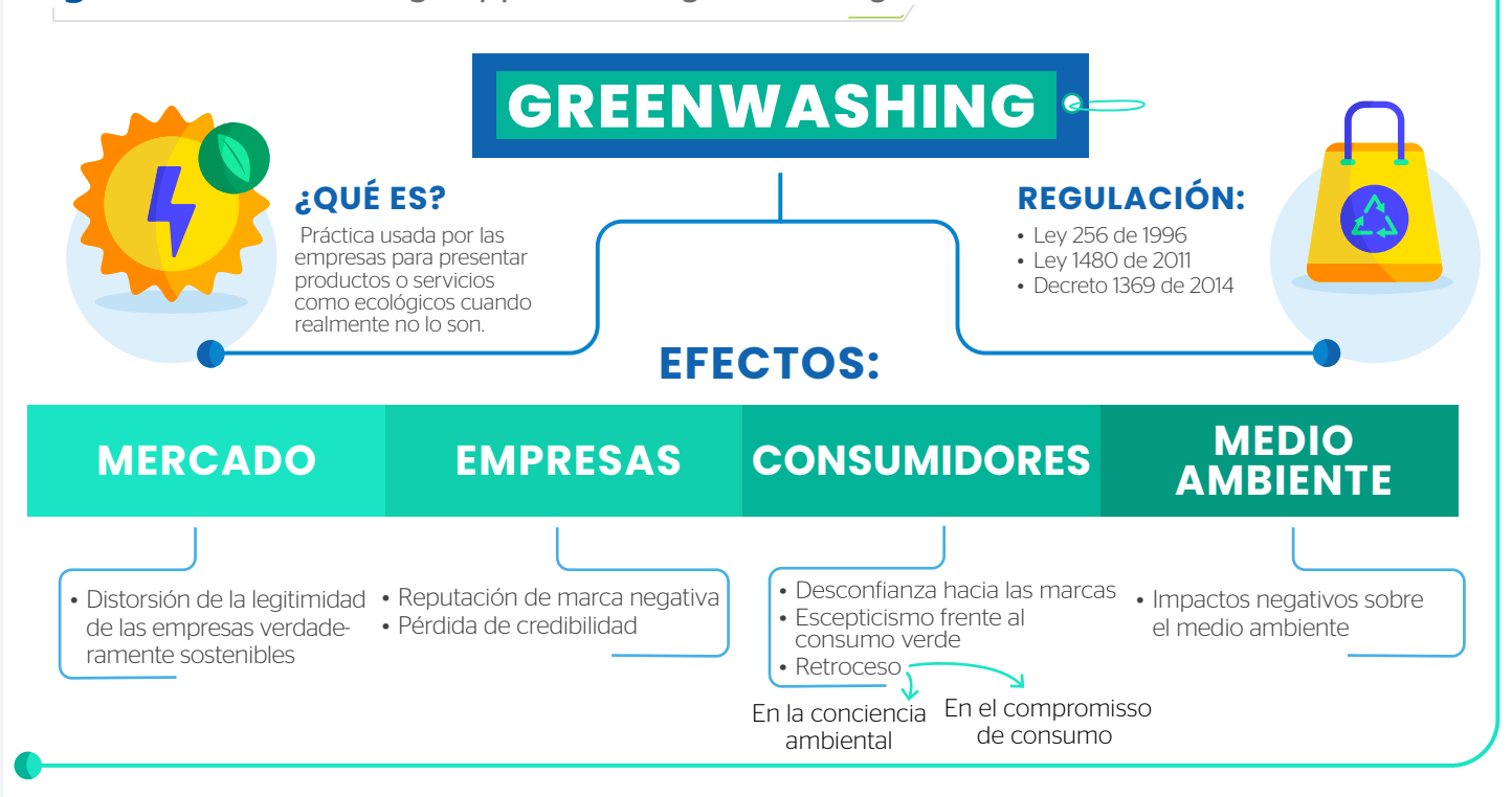
Figura 2. Efectos, estrategias y pecados del greenwashing

En resumen, y tal como se muestra en la figura 2 el greenwashing no es un asunto menor al interior de las empresas u organizaciones dado que como práctica puede tener efectos y consecuencias importantes que no solo afectan a las empresas y al mercado en términos de rentabilidad, sino a los consumidores en su compromiso de consumo y al medio ambiente por los impactos negativos que se generan.