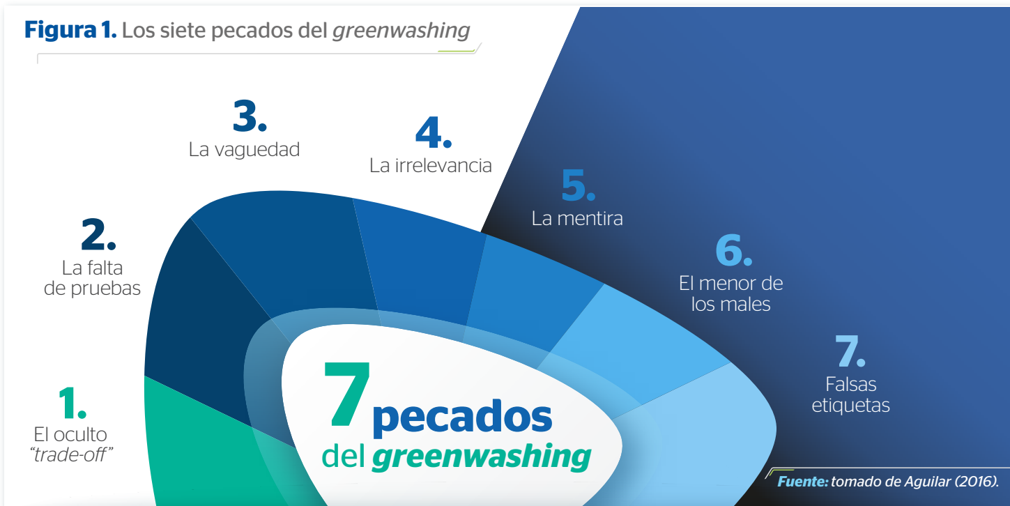
Figura 1. Los siete pecados del greenwashing

En su análisis del marketing verde como una oportunidad para las organizaciones, Aguilar (2016) refiere el estudio realizado en 2007 por la agencia canadiense Terra Choice que consistió en comprobar la autenticidad de las etiquetas de más de 1000 productos verdes. De esta investigación surgieron en su momento “Los seis pecados del greenwashing ”. Dos años después, al realizar nuevamente el estudio, se sumó otro pecado por lo que ahora se conocen como “Los siete pecados del greenwashing ” que se relacionan en la figura 1.